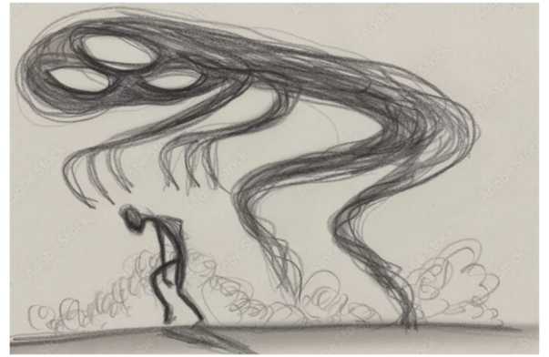
Figure 4 "L'homme déprimé submergé par la peur et la tristesse" Le regard des autres. Illustration de Carla Francesca CASTAGNO