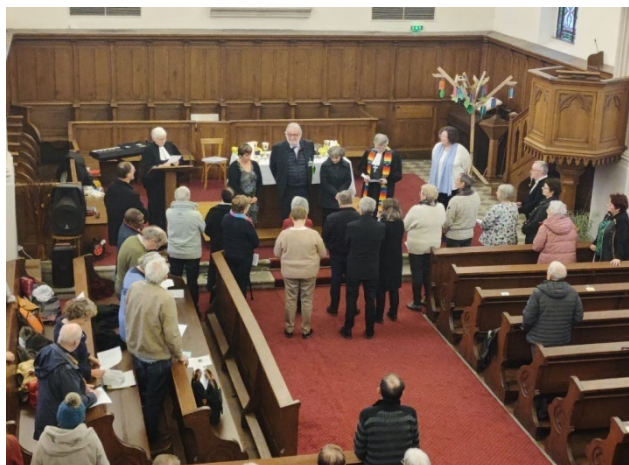
Figure 1