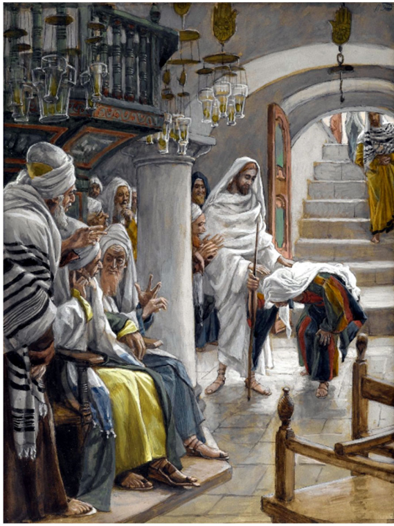
Figure 3 Jésus guérissant la femme courbée le jour du sabbat 1886-1896. James TISSOT