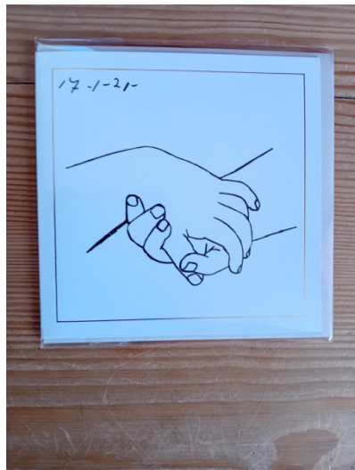
Figure 2

A 14h30 nous étions 4 puis 5, alors un éclair de regard du Seigneur me fait comprendre quelque chose car ceux qui étaient empêchés auraient tellement souhaité recevoir mon exposé sur "le regard". Donc l'Esprit Saint a œuvré et vite j'ai songé à improviser et c'est le mot "prière" que j'ai suggéré (aux 7 finalement présents) qui ont accepté avec enthousiasme.